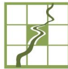
GAL Media Valle del Tevere